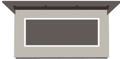
Frontbreite inkl. aller seitlichen Dachüberstände und Seitenverkleidungen links und rechts (gemessen an der breitesten Stelle)